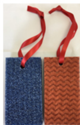
フッ素ガード 便器洗浄柄付きスポンジ GP030