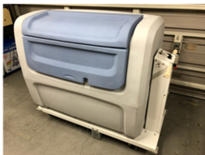
エレクトリックカート

電動式の台車の上に積載容量240Lのダストボックスを装着したもので、大量のゴミを運搬する際に、移動距離が長い場所や、傾斜がある場所に対して楽に運搬ができるよう設計されております。