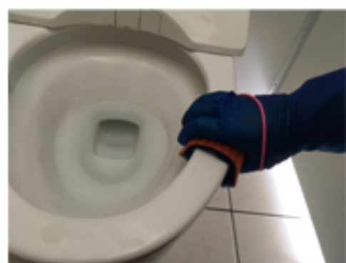
折り曲げてフチにフィット!