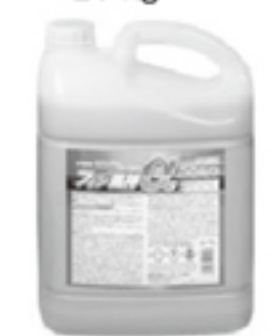
フィン風神α(アルファ) 5 kg

改良点①『超・低泡処方による作業性の向上』 従来のフィン風神は、アルミフィン吹き付け直後の泡立ちが目立ち、フィン内部までの洗浄液の浸透ならびに、すぎ時の消泡性に改良のご要望が多く御座いました。