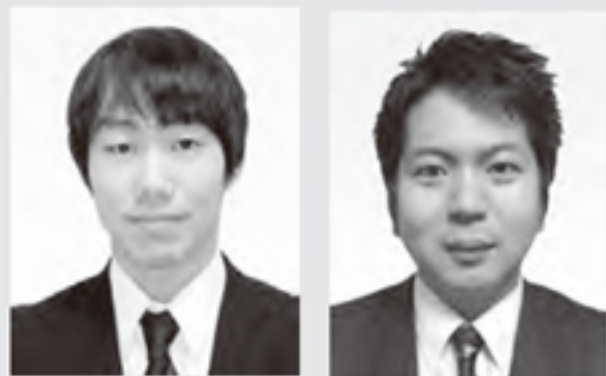
株式会社ユーホーニイタカ 株式会社ニイタカ