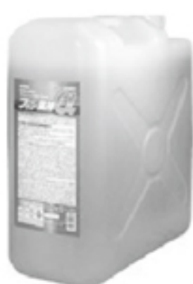
フィン風神α(アルファ) 20 kg