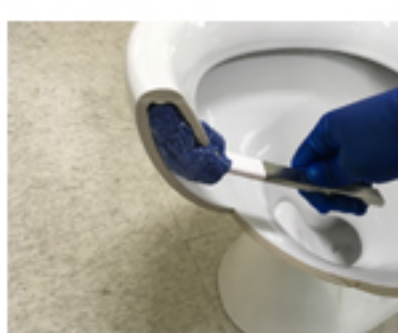
曲がるヘッドがフチ裏にフィット!