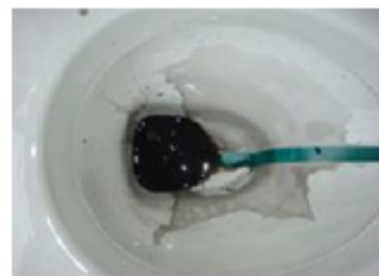
ランニングテスト開始時